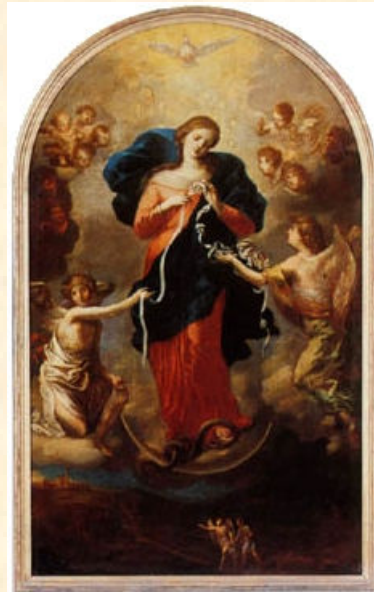
«Vergine che scioglie i nodi» ( Maria Knotenlöserin ) J. G. Melchior Schmidtner, 1700